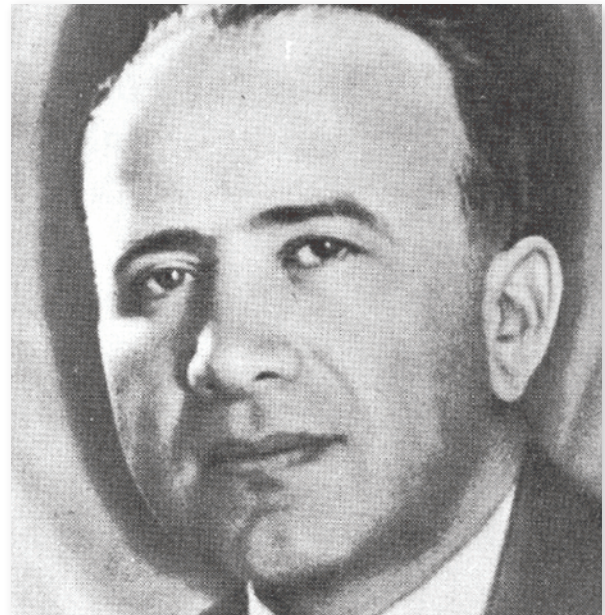
אוטו קומו 36

אקשטיין ניצל אישור שניתן לו מן השלטונות לחלוקת מזון כשר ליהודים ולעצורים במחנה המעבר פטרונקה (Patronka) שהוקם בבית חרושת נטוש בפאתי ברטיסלבה, כדי להעביר בחשאי מזון ומידע חיוניים ליהודים ששהו במסתור. אף שנאסר על אקשטיין לדבר עם שוכני המחנה, והובהר לו כי אם