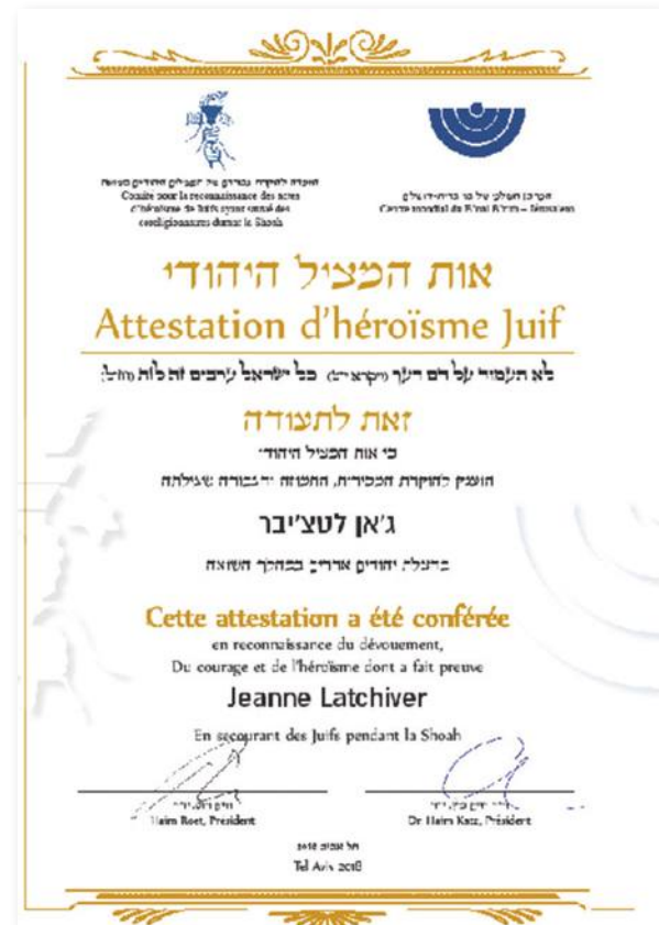
אות המציל היהודי

נראה כי חוסר הגדרת הנושא בספרות המחקר תחת קטגוריה מיוחדת או כתופעה נפרדת נובע במידה רבה מהנחות מוקדמות, שרווחו בקרב חוקרי השואה במשך שנים רבות לאחר השואה, לגבי אופי העזרה של יהודים ליהודים ומניעיה. הנחות אלו החלו להשתנות במהלך השנים עם שינויים בכיווני המחקר, אשר התעמקו באישיות של היהודי בשואה ובתגובותיו למתרחש, ולא עסקו רק ביהודי כקורבן. למרות זאת יש מקום לציין מספר הנחות מוקדמות שעיכבו את חקר תופעת היהודים שהצילו יהודים, והן עדיין מייצגות תפיסה רווחת בציבור הרחב. הנחה אחת ראתה בעזרה של המצילים היהודים לא יותר מתופעה מקרית, פעולה של יהודים נרדפים אשר הייתה להם השפעה מוגבלת מאוד על גורלם שלהם ושל אחרים. דעה זו מבוססת על הנחה מוטעית, שקורבן אינו יכול להיות גם מציל. 8 הנחה שנייה ראתה בסולידריות בין יהודים דבר מובן מאליו שאין צורך להסביר את מניעיו, או לתת לו הכרה מיוחדת, בניגוד גמור לעזרה מצד לא-יהודים, הסותרת הנחות מסורתיות על אודות "שנאת עשוי ליעקב". הנחה נוספת הייתה שיהודים היו קורבנות פסיביים, חלוקים בינם לבין עצמם, ושמנהיגי קהילות רבים היו לא יעילים במקרה הטוב ומשתפי פעולה במקרה הגרוע. 9 חלק מהסיבות לכך שהמחקר לא התייחס לקטגוריה